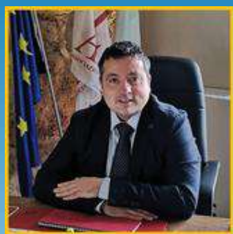
Interviene: Marcello PACIFICO Presidente nazionale

Per registrarti clicca qui: https://anief.org/as/CIR2