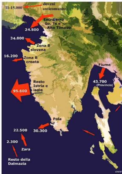
Luoghi di partenza